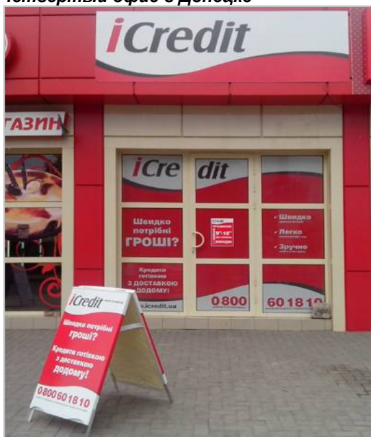
Четвертый офис в Донецке