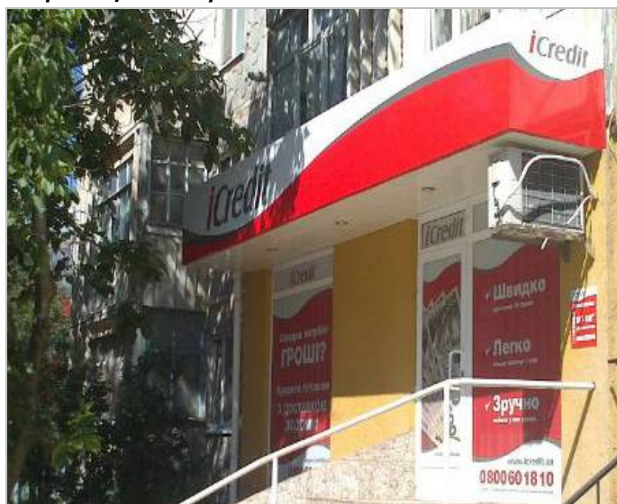
Второй офис в Херсоне