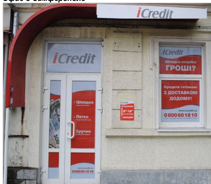
Офис в Симферополе