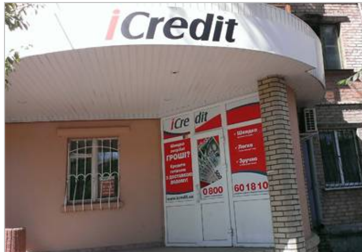
Второй офис в Луганске