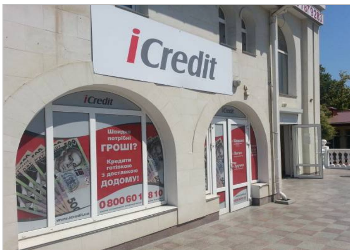
Офис в Севастополе